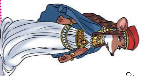
MAKEBA, KONINGIN VAN SHEBA